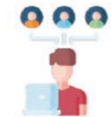
Direkter Austausch und Kontakt