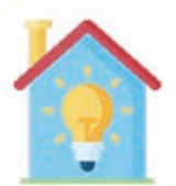
Projektarbeit vor Ort