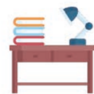
Selbststudium mit Erfolgsmessung